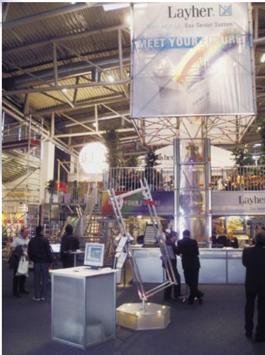
Layher gjorde ett starkt intryck på byggmässan Bauma 2004.

Det är bevisat igen! Layher är en stark, pålitlig och framgångsrik affärspartner. ■