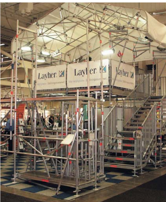
Layhers 108 kvadratmeter stora och välkomnande monter är fylld av produkter som underlättar ställningsanvändarens vardag.