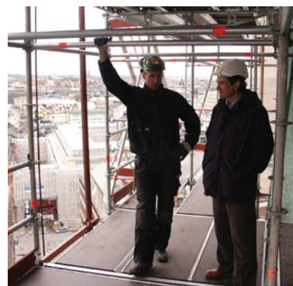
▲ Vy över Stockholm från kyrktornet.

Han berättar att det viktigaste med en ställning är att den är rätt byggd för ända-